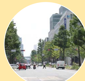
愛日地域のようす