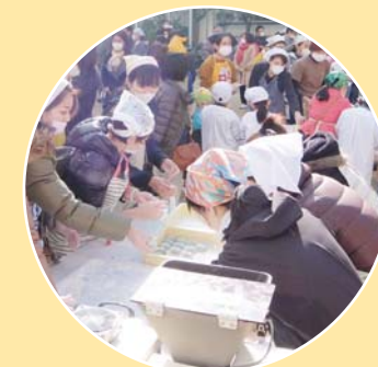
開平地域もちつき大会