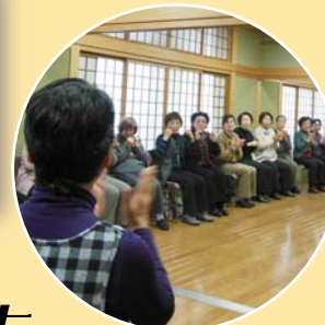
高齢者いきいき事業 高齢者ふれあい事業